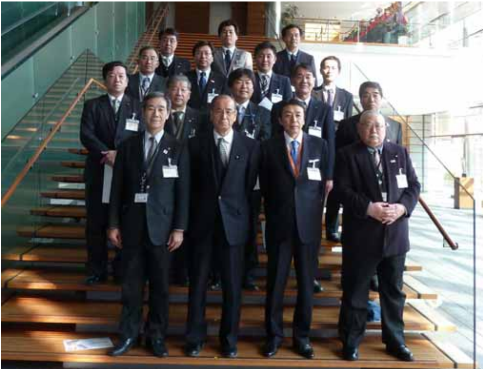
鈴木克昌幹事長代理と首相官邸にて(上)