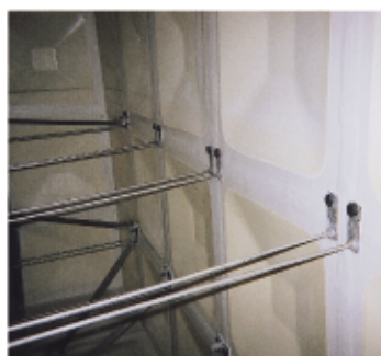
接続部 FRP ライニング