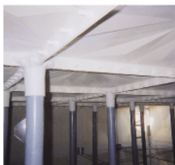
内部耐震補強支柱群