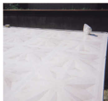
接続面のライニング後全体を前処理 後塗装完成写真

屋根のボルト接続面より雨進入（パッキンボルトの不具合もしくは長年による老化）FRP ライニングにより組み付け接続部への強化及び漏水の止水